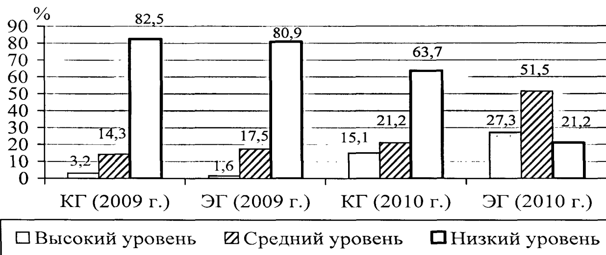
Рисунок 2. – Распределение студентов 4 курса ЧГИФК по уровням успешности обучения в начале (2009 г.) и конце (2010 г.) эксперимента (дисциплина «Спортивная медицина»)

На рисунке 2 представлены итоговые результаты успешности обучения студентов.