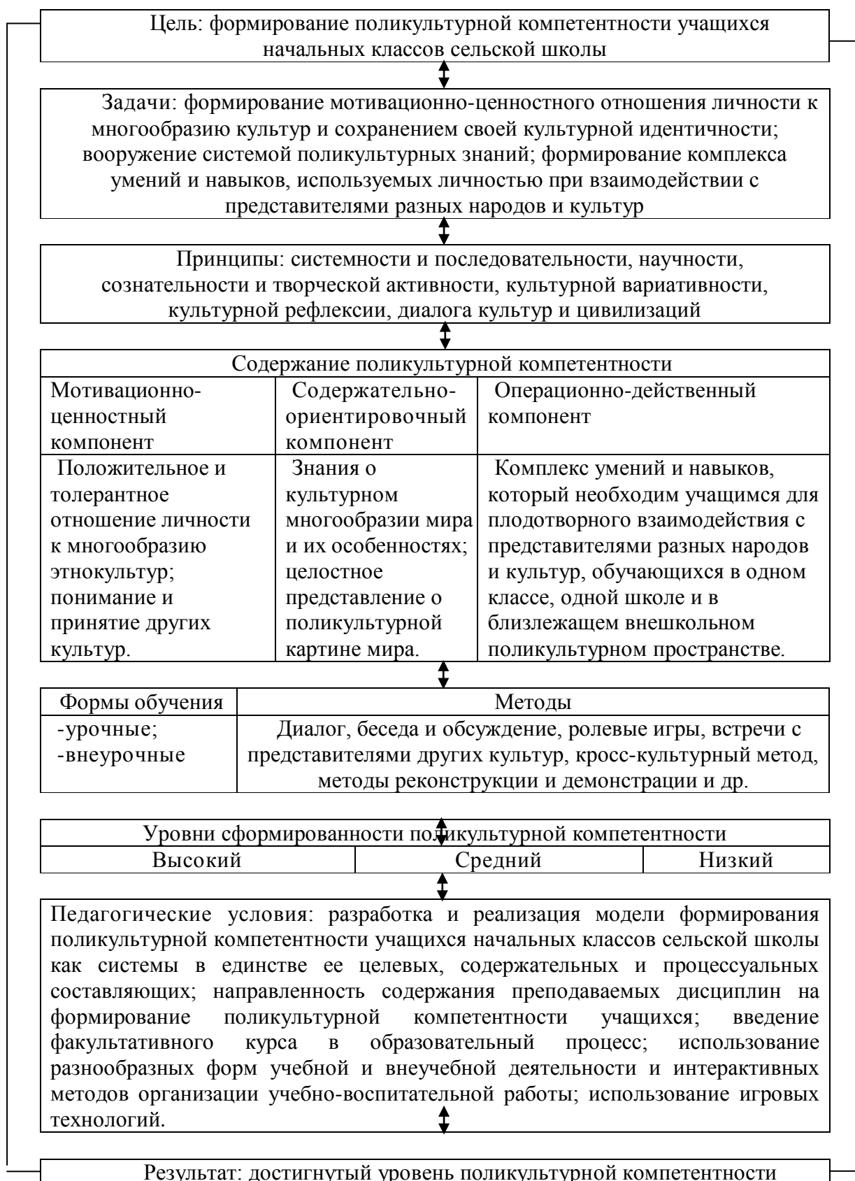
Рис. 1. Поликомпонентная модель формирования поликультурной компетентности учащихся начальных классов сельской школы