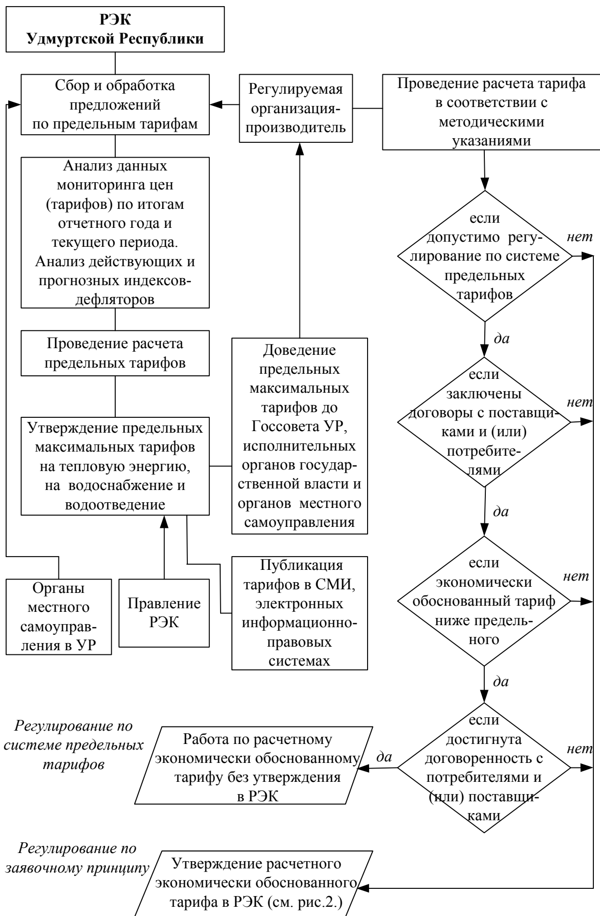
Рис. 3. Схема принятия решений по тарифам, утверждаемым по системе предельных тарифов