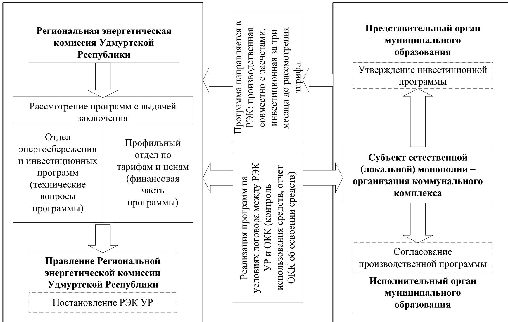
Рис. 5 Схема реализации производственной и инвестиционной программ субъектами естественной и локальной монополий – организациями коммунального комплекса в Удмуртской Республике.