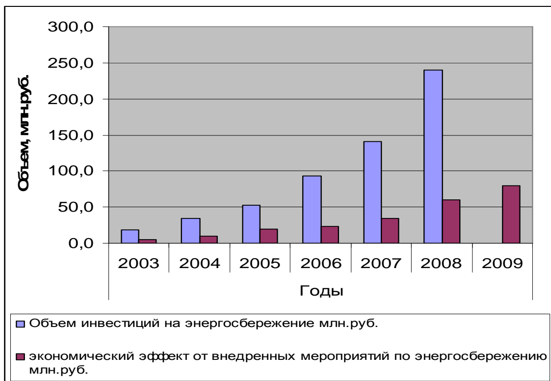
Рис. 6. Динамика изменения средств на энергоресурсосбережение в организациях электро-, тепло-, водоснабжения и водоотведения Удмуртской Республики в 2003-2009 годах.

случае срыва ей графика реализации программы, а также нецелевого использования средств. Организация отчитывается перед регулирующим органом об освоении средств и исполнении программы по утвержденной форме отчета.